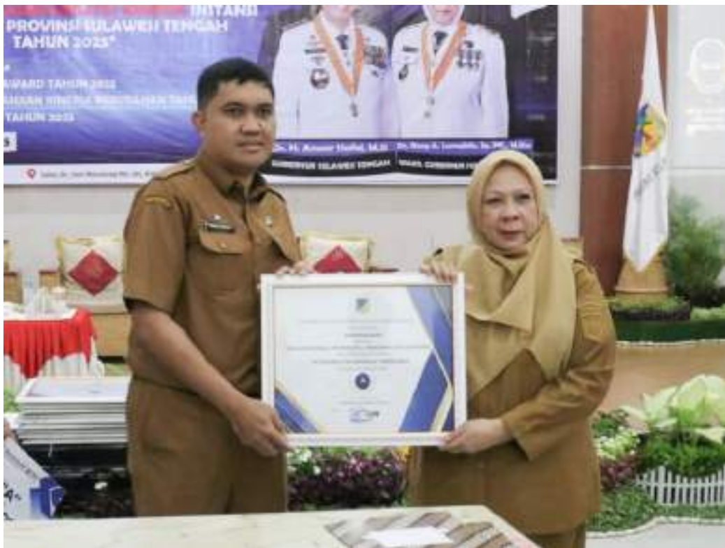
Gambar Penghargaan Indeks SAKIP OPD Pemerintah Provinsi Sulawesi Tengah Tahun 2024

Pada tahun 2025 Dinas Komunikasi, Informatika, Persandian dan Statistik Provinsi Sulawesi Tengah mendapat penghargaan di tingkat provinsi yakni Penilaian SAKIP Tahun 2024 yang mana Dinas Komunikasi, Informatika, Persandian dan Statistik Provinsi Sulawesi Tengah mendapat penghargaan dari Gubernur Sulawesi Tengah, menyandang predikat “A” dengan nilai 84,10 poin sekaligus menempatkan posisi Dinas Kominfosantik pada Urutan ke-5 dari seluruh OPD lingkup Pemerintah Provinsi Sulawesi Tengah.